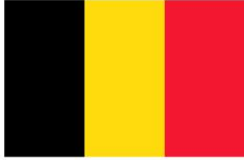
Drapeau du royaume de Belgique