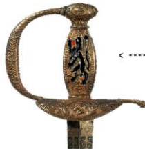
La poignée B