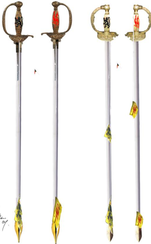
Flèches Coq et Lion sculptée /Bronze or propositions A et B