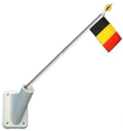
mini mât , mini pommeau doré et mini drapeau belge

Alou - hauts par Benedicte Jolley Kostynke / belge par taylor fig 02.