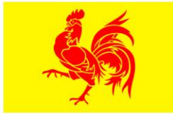
Drapeau de la communauté wallonne de Belgique