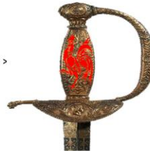
La poignée A