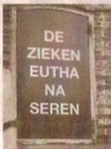
Een van de panelen die niet door de beugel kon voor de burgemeester.

Voorzitter van het adviescomité sculpturen in de stad is Stefaan De Clerck. «We hebben nooit uitleg gekregen van de burgemeester. Hij moet begrijpen dat een kunstenaar in tegenstelling tot een politicus geen compromissen kan sluiten. Voorbijgangers kunnen toch gewoon verder wandelen in-